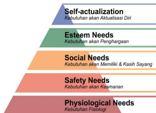
Gambar 1. Hierarchy lima Kebutuhan

Lima kebutuhan dasar teori Abraham Maslow ini terdiri dari kebutuhan fisiologis (physiological needs), kebutuhan akan keamanan (safety needs), kebutuhan social (social needs), kebutuhan akan penghargaan (esteem needs) dan kebutuhan akan aktualisasi diri (self actualization). Hierarchy lima kebutuhan maslow dijelaskan sebagai berikut: