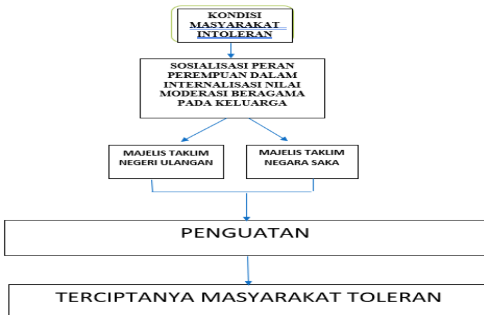
Gambar 2. Bagan Alur Kegiatan Penguatan Peran Perempuan dalam Penanaman Nilai-Nilai Moderasi Beragama

Hasil riset pemberdayaan ini memaparkan beberapa temuan terkait penguatan peran perempuan dalam menanamkan nilai-nilai moderasi beragama pada keluarga di Majelis Taklim Negeri Ulangan, Kabupaten Pesawaran, yakni sebagaimana tergambar pada bagan berikut ini: