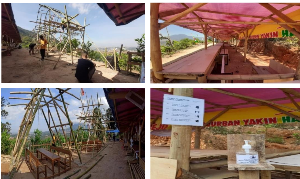
Gambar 4. Proses Pembuatan Lokasi Bazar Gantoeng

Secara bertahap aktivitas berjalan sesuai rencana. Cuaca cerah yang belum memasuki musim hujan menyebabkan kegiatan dari pagi sampai sore dalam waktu 20 hari dimulai dari persiapan, pelaksanaan dan terselesaikannya. Antusias warga, Karang Taruna, serta bersinergi dengan peserta pengabdian, memberikan motivasi bahwa yang diharapkan akan mampu terwujud. di dalam pembuatan desain, peserta pengabdian khususnya dari Program Studi Arsitektur bersama- sama dengan yang lainnya, berupaya agar apa yang dikerjakan tidak memunculkan dampak yang merugikan lingkungan.