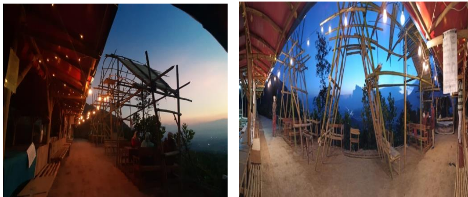
Gambar 6. Realisasi Ide Bazar Gantoeng

menghemat waktu. Dengan pembagian tugas yang jelas dan disepakati di awal kegiatan, maka dengan runtut bisa menyelesaikannya.