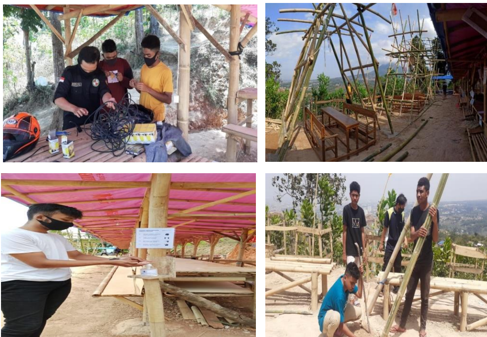
Gambar 5. Bergotong Royong dan Pembagian Tugas Dalam Melaksanakan Program

Dengan keterbatasan waktu kegiatan, bersama mengerjakan dalam merakit dan juga melakukan aktivitas agar tujuan pembuatan dapat segera terealisasi. Kebersamaan dalam pengerjaannya adalah suatu peristiwa penting, karena gotong royong yang jarang sekali dilakukan oleh masyarakat perkotaan, di tempat ini satu dengan yang lain saling memberi waktu dan tenaga. Ini adalah bentuk sosialisasi, interaksi serta kolaborasi bahwa akademisi dapat diterima oleh masyarakat dengan ide- ide inovatifnya. Misalnya, bahwa dalam mendapatkan bahan- bahan yang diperlukan, peserta mengelola keberadaan potensi yang ada sehingga menjadi peluang secara ekonomi. Anggaran yang diperlukan dapat terukur dengan keuangan peserta, efisien waktu dan tenaga. Selain bahan dasar bambu, juga disiapkan handsanitizer, lampu tumbler, lampu bohlam, kabel lampu fitting, trashbag, serta botol hand sanitizer.