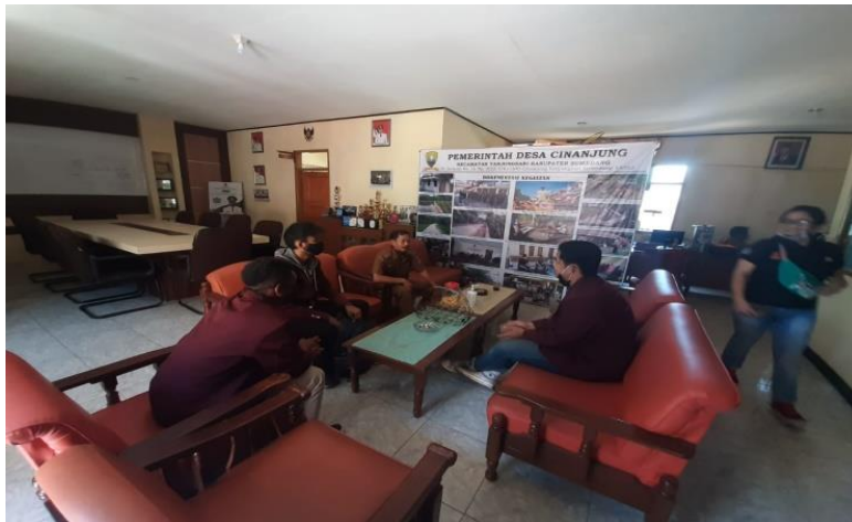
Gambar 1. Silaturahmi dan Penyerahan Administrasi Perijinan Kegiatan Ke Kepala Desa Cinanjung

Diskusi singkat menyampaikan program kerja serta perkenalan antara peserta dengan Kepala Desa Cinanjung, disampaikan pemberian ijin dan anjuran dalam pelaksanaan kegiatan sehingga tidak melanggar aturan yang telah ditetapkan oleh Pemerintah Pusat dan Daerah serta untuk dengan cepat mampu beradaptasi dengan masyarakat. Adapun desain bazar gantung dapat dilihat pada gambar berikut.